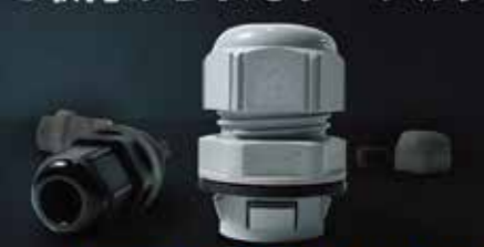
SKINTOP CLICK / CLICK-Rの概要