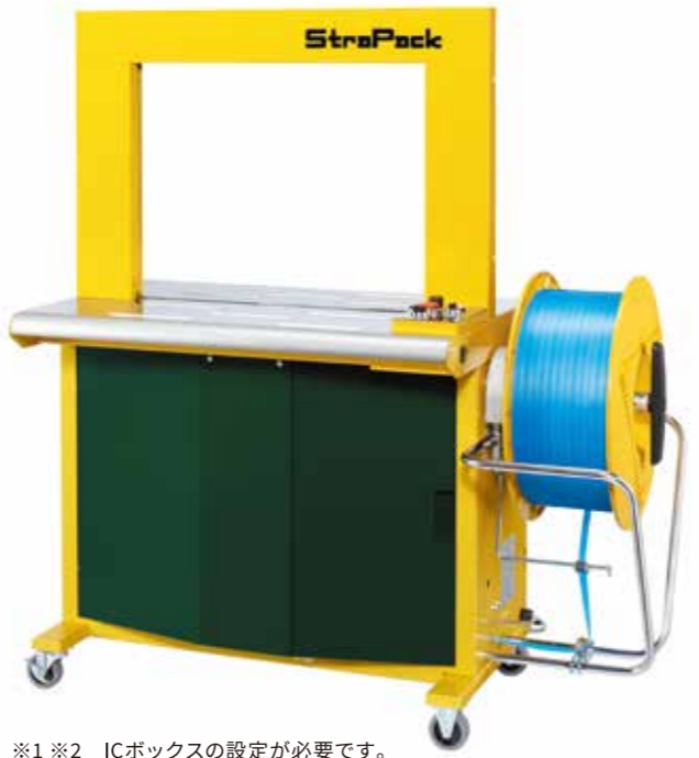
※1 ※2 ICボックスの設定が必要です。