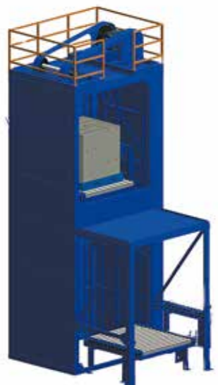
垂直搬送機「リフコン」

不二輸送機工業はロボットだけでなく、垂直搬送機「リフコン」も製作しています。カゴ台車やカートトラックも多層階へ搬送できる「スーパーリフコン」はたくさんの工場・物流倉庫でご愛顧いただいております。サーボモーターを使用することでランニングコストは当社比約40%削減しております。